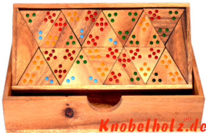
Triomino das Dreiecks Domino mit 3 eckigen Dominosteinen....hier legen wir so an das je 2 Zahlen übereinstimmen....interessantes Domino für bis zu 8 Spieler....