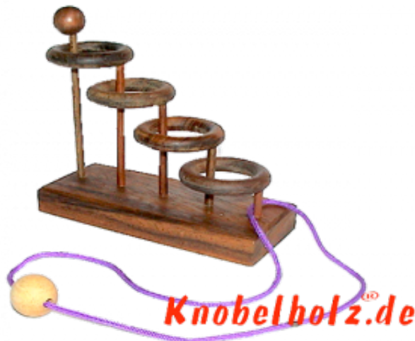
4 Ringe Leiter Puzzle und eine Schnur führe die Schnur aus den 4 Ringen.... ??????