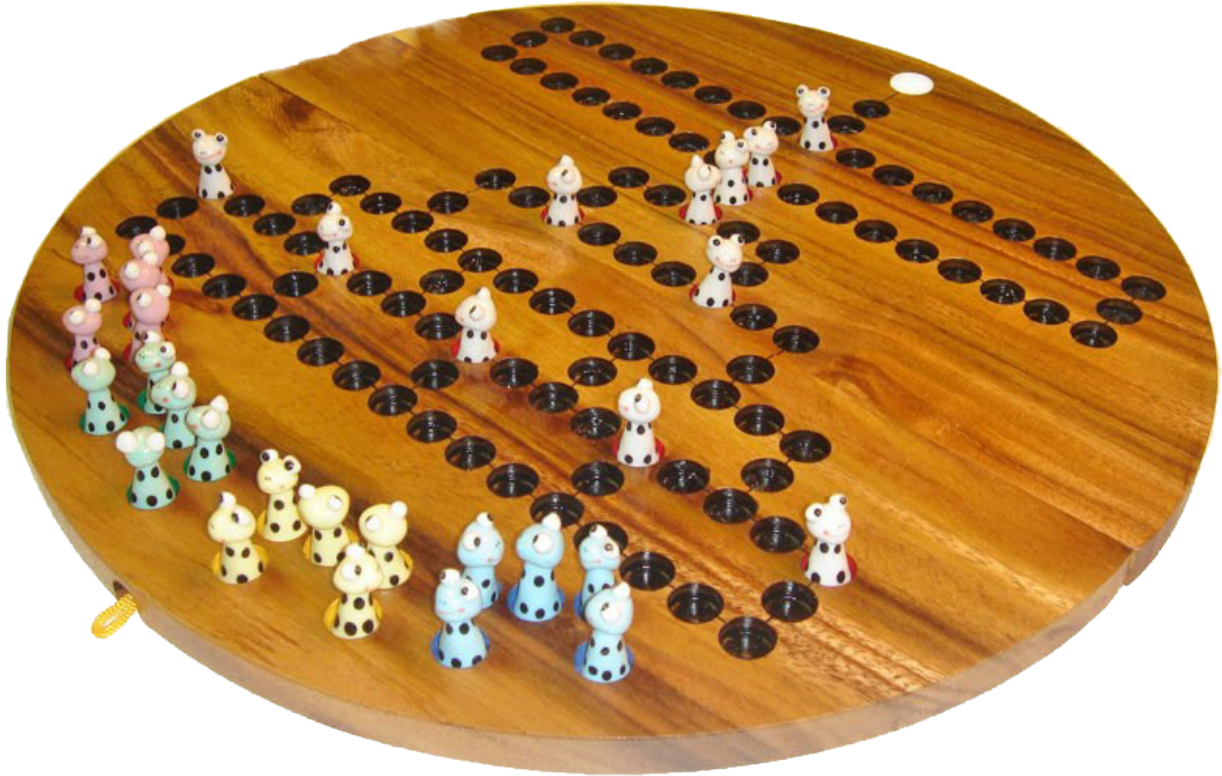
Barrikade Frog, Blockade Würfelspiel aus Samanea Holz mit den Maßen 39,0 x 39,0 x 3,5 cm , barricade wooden game board round monkey pod