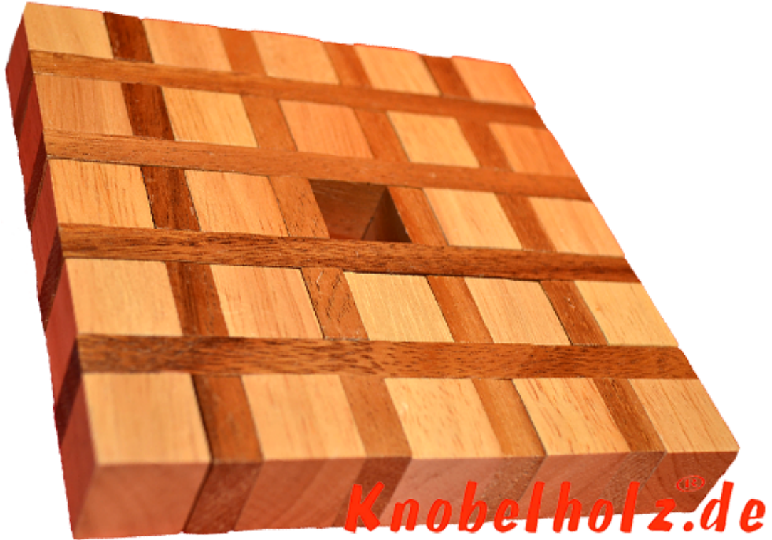
Kaffeedeckchen das Kaffeekannen Untersetzer Puzzle Kaffeeklatsch Maße 14,0 x 14,0 x 2,0 cm , parquet samanea wooden puzzle