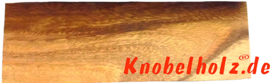
Pagoda Turm von Hanoi mit 7 Platten Logikspiel in einer Holzbox in Maßen 20,8 x 8,4 x 3,4 cm , pagoda 7 level samanea wooden puzzle