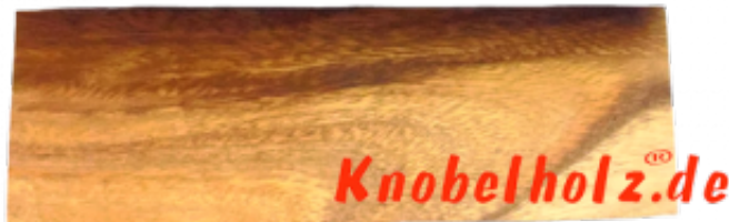
Pagoda der Turm von Hanoi mit 9 Platten. Bringe den Turm vom Mittleren Stab auf einen Seitenstab....aber Du darfst nur eine Scheibe nehmen und keine kleine auf eine große legen...nur kleine auf größere... ??????,00€ ? ? ? ? ? ? ? ? ? ?